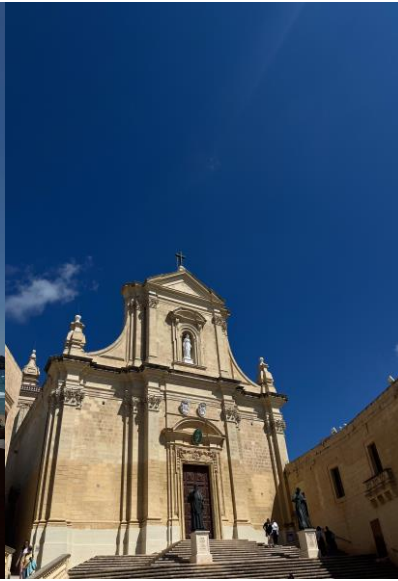
Old prison (Gozo)